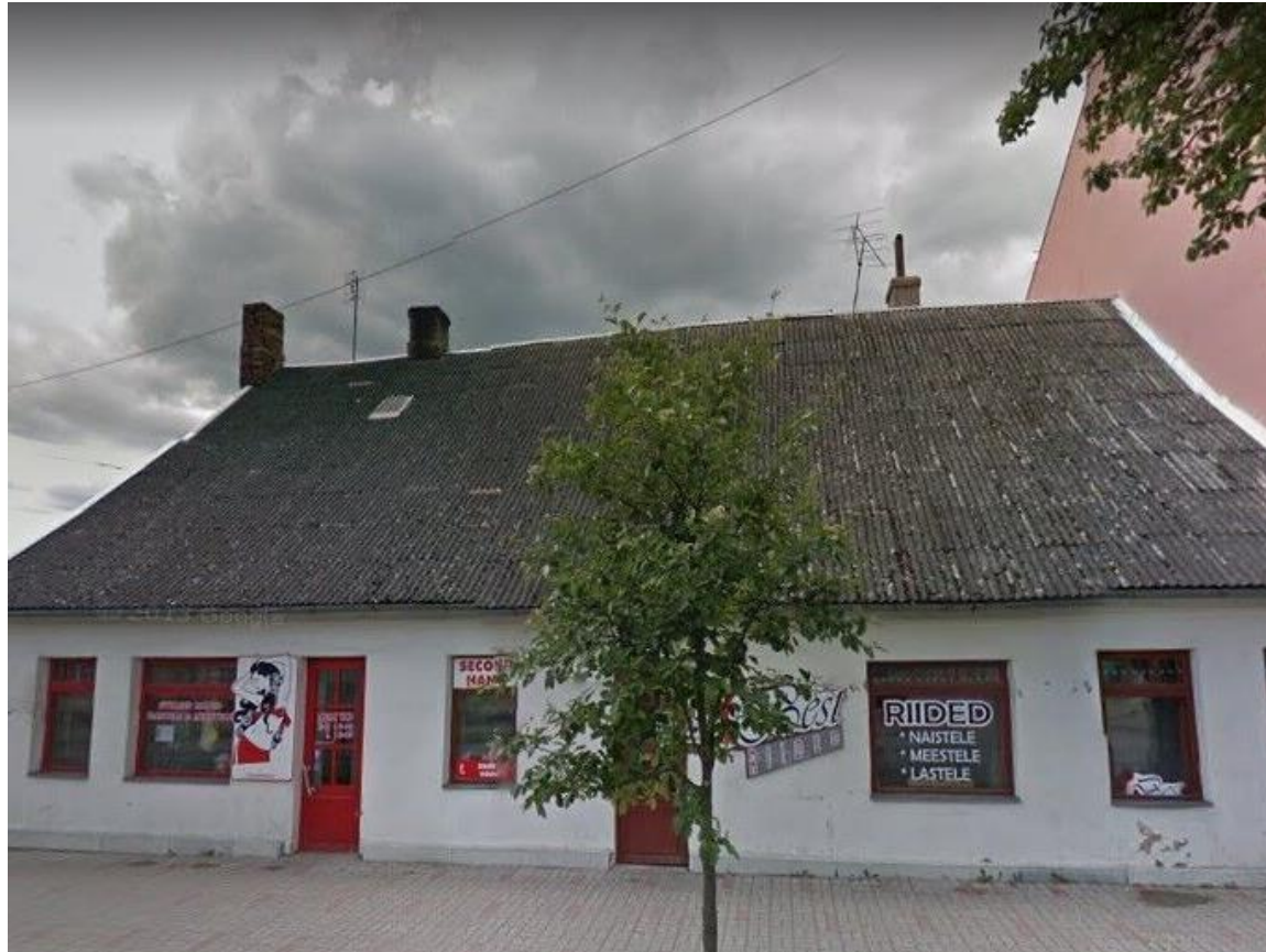
Seasaare kõrts täna, lubatud lammutada.